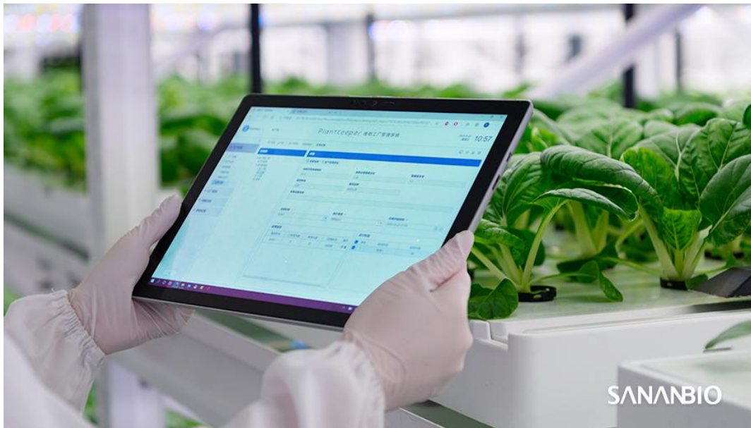
种植者可通过 PlantKeeper™ 监管植物工厂内环境