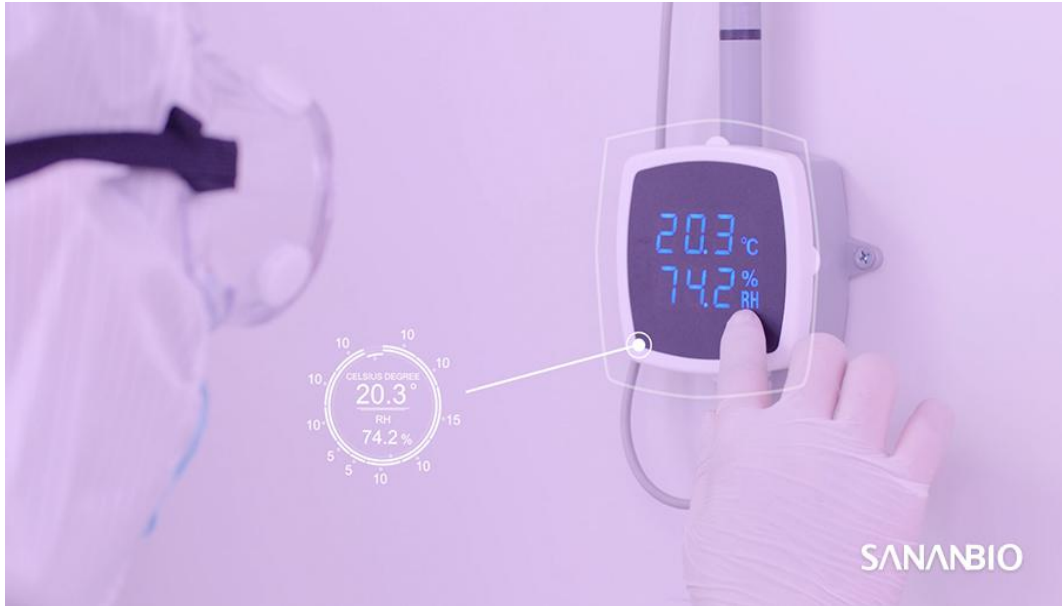
植物工厂温湿度监测

空气相对湿度是影响植物生长的一大关键因素，它关系着植物的产量。植物工厂种植中，需要实时监测空气温湿度，并观察不同作物的生长情况，及时调整温湿度。